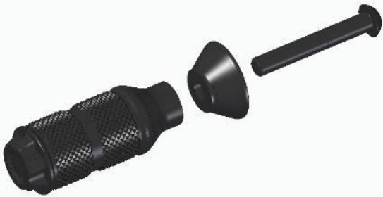
Springfield ab Modell 2017