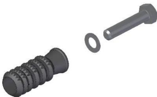
FTR 1200 ab Modell 2019