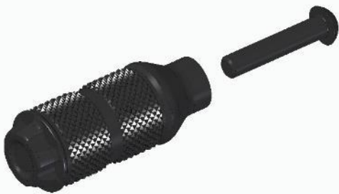
Scout Bobber ab Modell 2018