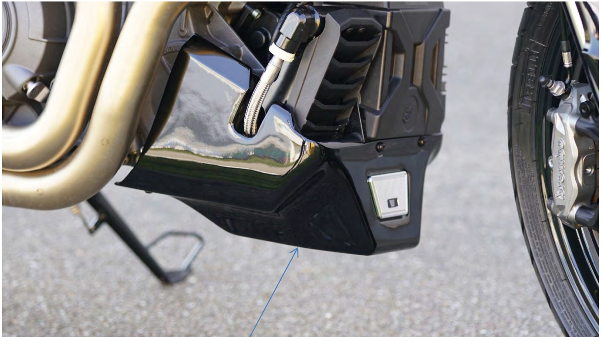
Bugspoiler, Typ VKT